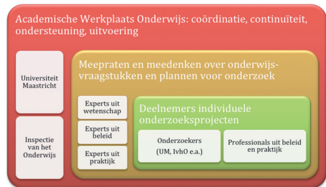
Figuur 2: verschillende participatievormen Academische Werkplaats Onderwijs

Heeft u een vraag of idee waarover u eens van gedachten zou willen wisselen met andere participanten in de Academische Werkplaats Onderwijs? Heeft u op uw school of in uw schoolbestuur te maken met vraagstukken die u graag eens in dialoog en samenwerking met andere betrokkenen uit onderzoek, beleid en praktijk nader zou willen verkennen? Wilt u bepaalde vraagstukken agenderen of heeft u ideeën over nieuwe thema's of vormen van onderzoek die volgens u nodig eens opgepakt zouden moeten worden? Wij nodigen u van harte uit om mee te denken en mee te doen: pak een hamer en doe mee!